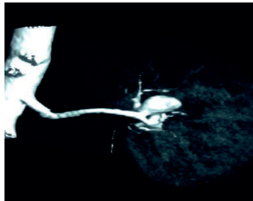
Рисунок 1. Компьютерная томография донора. Определяется аневризма сегментарной артерии почки

Результаты. Была выполнена лапароскопическая мануально – ассистированная донорская нефрэктомия. На «back-table» выделена сегментарная артерия левой почки и на основание аневризмы была наложена титановая клипса (Рис 2.).